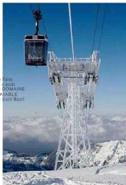
De Flaine, on a accès au DOMAINE SKIABLE du Grand-Massif.

Le Pashmina, à partir de 290 € la nuit en chambre double et en demi-pension. www.hotelpashmina.com Restaurant Jean Sulpice, Val-Thorens, 04-79-40-00-71. Menus à partir de 78 €.