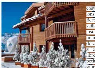
A l'hôtel TOTEM de Flaine, (en haut et ci-dessous), c'est la dolce vita à la carte. A Val Thorens, le PASHMINA (ci-dessus) propose du luxe sans ostentation. Chez MAMA THRESL (page de droite), on se love avec délectation dans la salle de méditation.