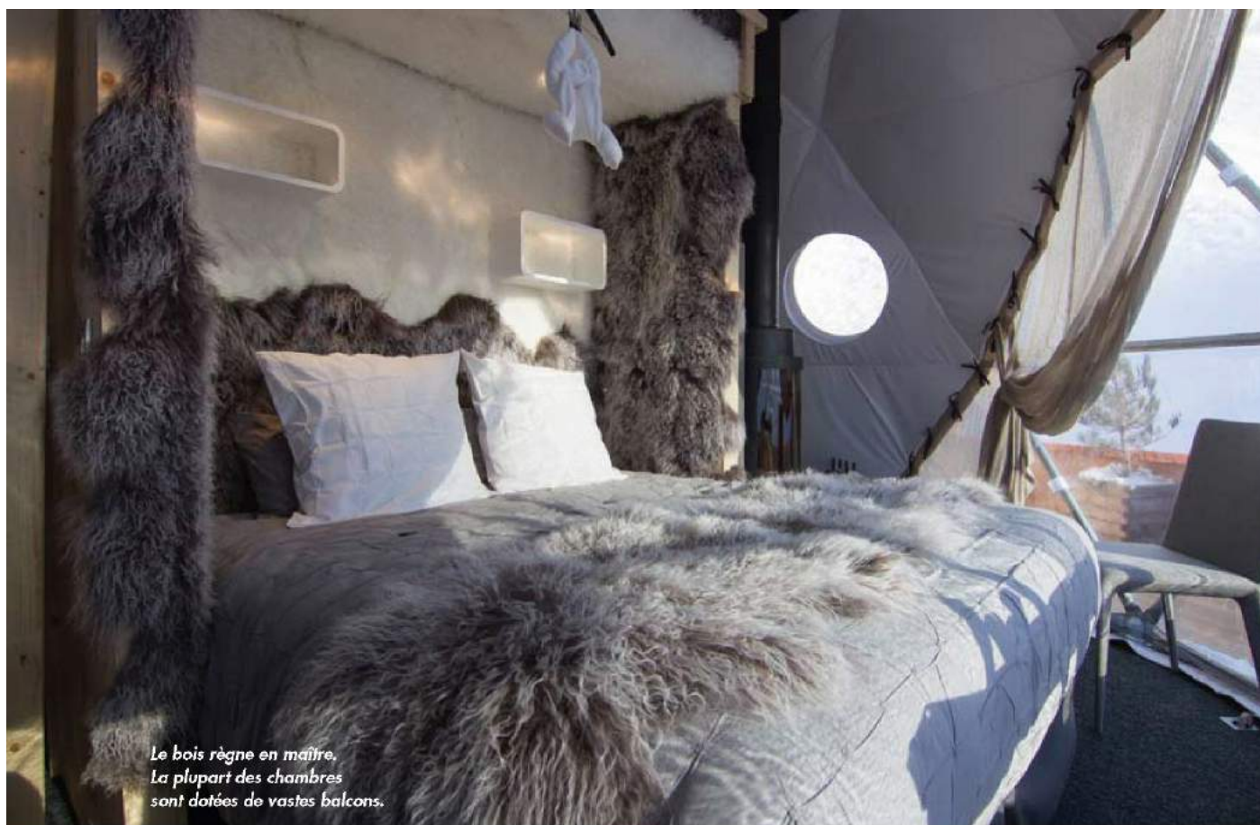
Le bois règne en maître. La plupart des chambres sont dotées de vastes balcons.