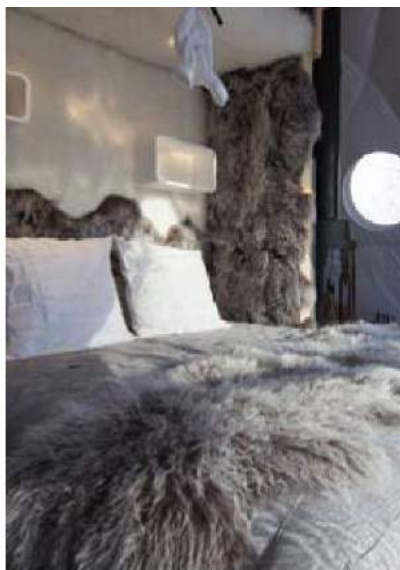
FRANCE / VAL D'ISÈRE